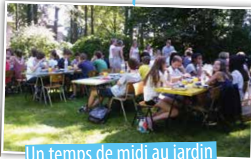
Un temps de midi au jardin

Visite d'une ancienne ardoisière souterraine, d'une brasserie, du comptoir forestier, de la citadelle de Montmédy, observations paysagères, balades dans des villages typiques, ascension d'une cuesta, écoute nocturne du brame du cerf... ont permis aux élèves de l'option géographie 4h (5ème et 6ème) de mettre en évidence les principales caractéristiques des régions les plus méridionales de notre pays (Ardenne et Gaume) et du nord de la Lorraine française.