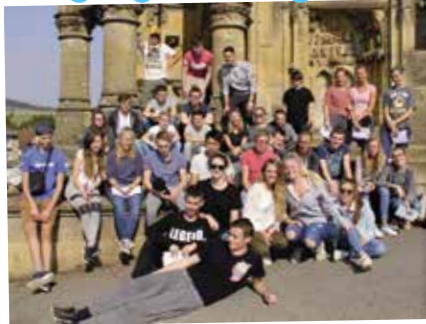
De la Gaume à la Lorraine

Visite d'une ancienne ardoisière souterraine, d'une brasserie, du comptoir forestier, de la citadelle de Montmédy, observations paysagères, balades dans des villages typiques, ascension d'une cuesta, écoute nocturne du brame du cerf... ont permis aux élèves de l'option géographie 4h (5ème et 6ème) de mettre en évidence les principales caractéristiques des régions les plus méridionales de notre pays (Ardenne et Gaume) et du nord de la Lorraine française.