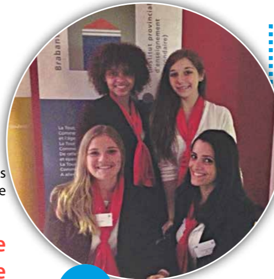
Les 5 P Restaurateur IPAM

En date du 13 octobre 2016, nous, les élèves de 6ème qualification accueil tourisme, accompagnés des professionnels auxiliaires d'accueil, nous sommes rendus au Cinéscope de Louvain-la-Neuve afin d'accueillir les professeurs lors de la rentrée académique.