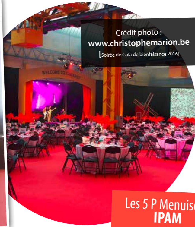
[Soirée de Gala de bienfaisance 2016]