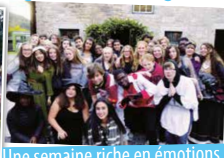
Une semaine riche en émotions

Les élèves pouvaient choisir deux cours différents et étaient épaulés dans leur travail par des professeurs de la branche. Les mots d'ordre étaient travail, bienveillance et convivialité.