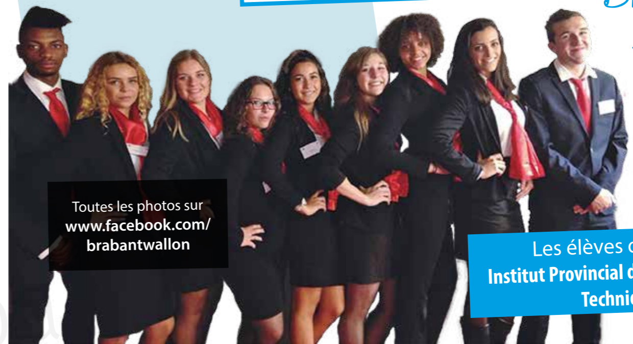
Toutes les photos sur www.facebook.com/brabantwallon